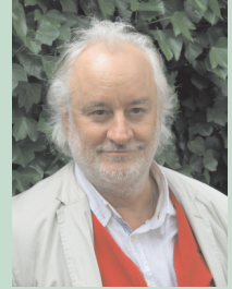
Ton Daiken Akveld Distributie/Redigeren Column