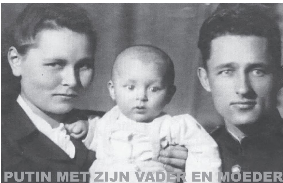
PUTIN MET ZIJN VADER EN MOEDER